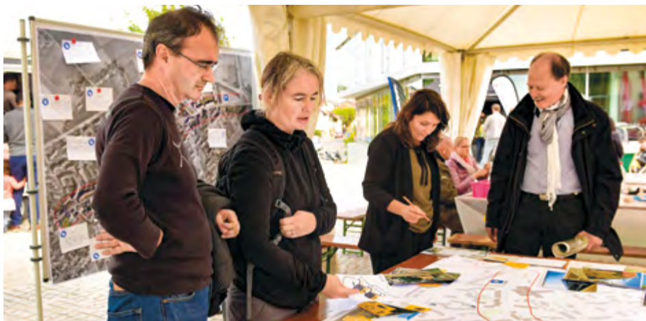
Atelier lors de la journée "Bernex Signal d'avenir" consacrée à l'urbanisme