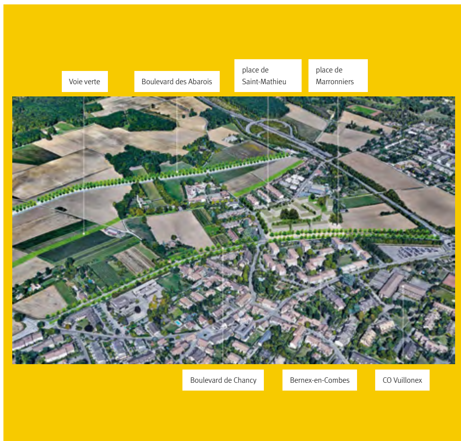
Plan de situation général du quartier de Saint-Mathieu