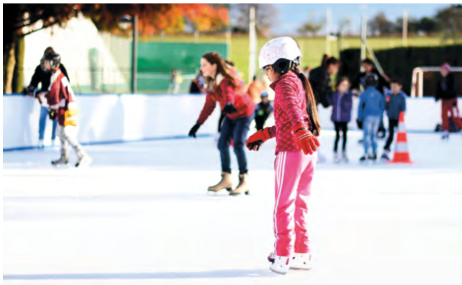
Patinoire de Bernex