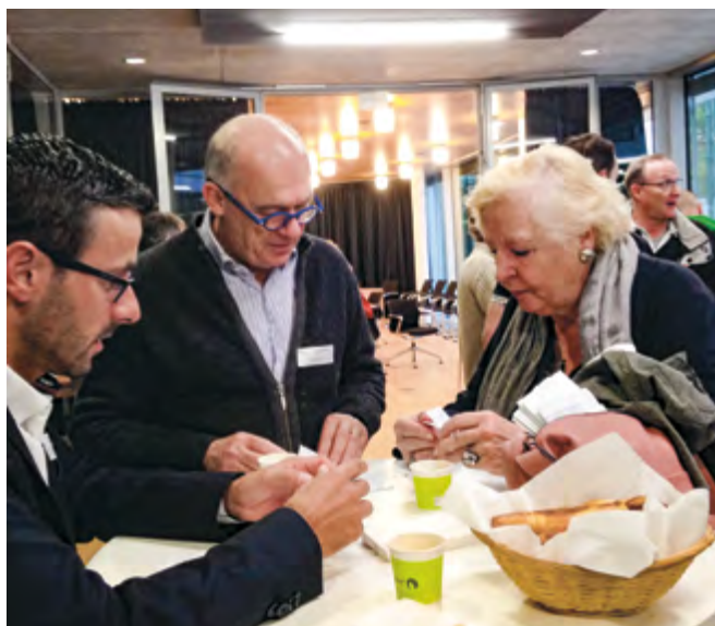
Petits déjeuners des entreprises